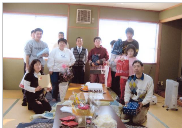
クリスマス会（12月24日）