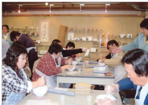
お香作り体験・淡路島（11月10日）