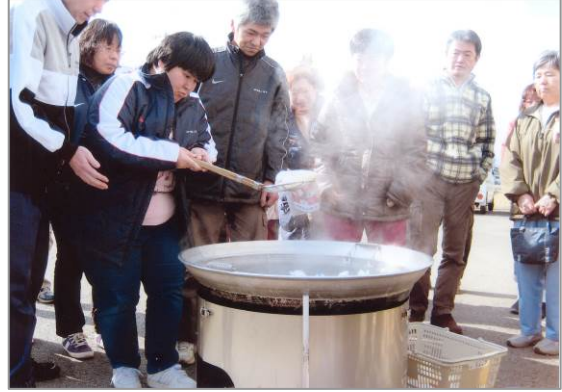
災害時炊き出し訓練

(1月26日) 特別な袋にお米を入れて、沸騰したお鍋で30分! カレーライスでいただきました。 福祉総務課主催