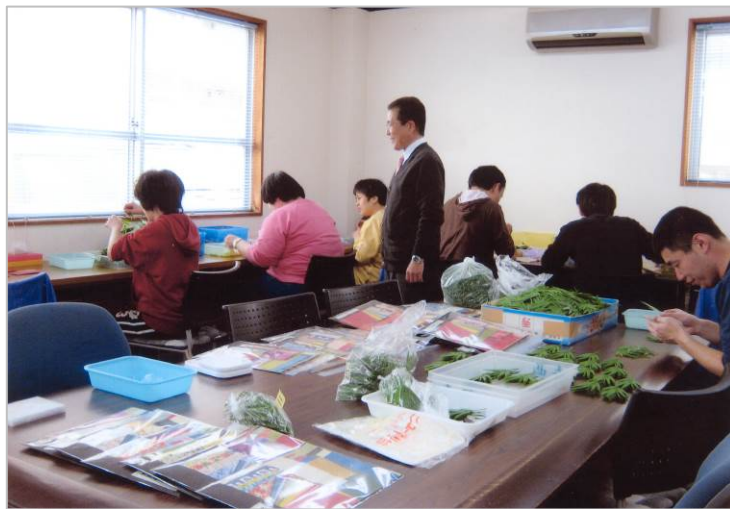
NPO 法人 巢立・作業風景