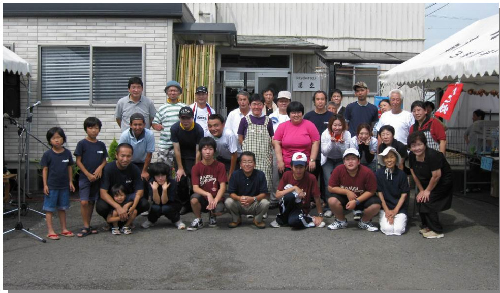
“巢立まつり” ボランティアさんと一緒に!! (2009年7月25日)