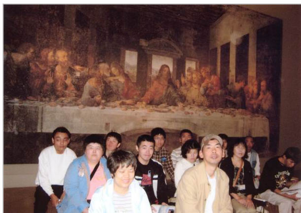
大塚国際美術館（10月6日）

今年は、新型インフルエンザの流行で、予定の変更を余儀なくされたこともありましたが、例年以上に色々なところを訪問し、さまざまな体験ができた一年でした。