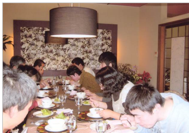
マナー研修・フランス料理（1月14日）