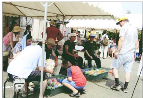
密かな人気のヨーヨー祭り