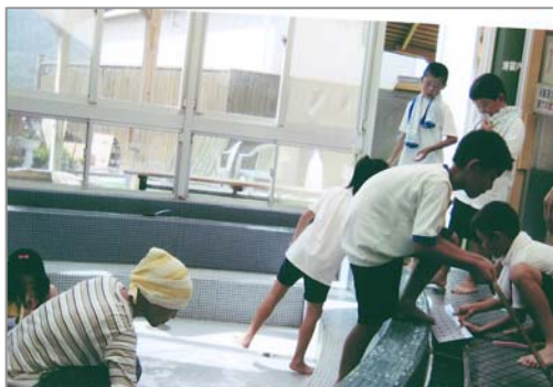
9月22日、飯尾敷地小学校の4年生が鴨の湯の清掃体験