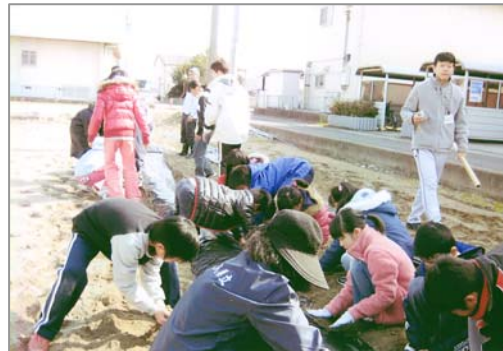
2月8日、知恵島小学校の4年生と一緒にジャガイモの植え付け