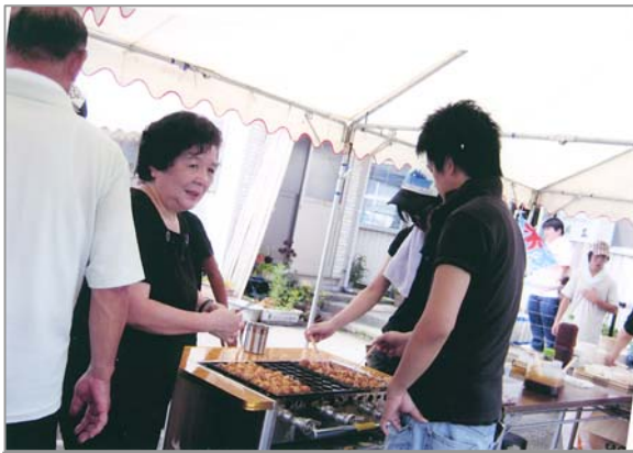
毎年、大人気のたこ焼き

「巣立まつり」も支援して下さる皆様のおかげで、10回を迎えることができました。毎年素敵な歌声を聞かせてくれる「まちかどコンサート」のカマンベールの皆さんは、NHKのバンドコンテスト第14回「熱血！オヤジバトル」で全国優勝をされました。今年の「巣立まつり」が一段と楽しみです。