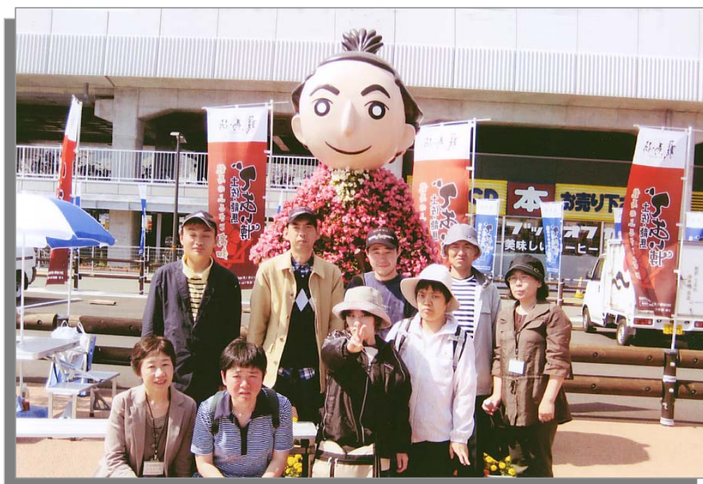
龍馬博（5月14日、高知県）